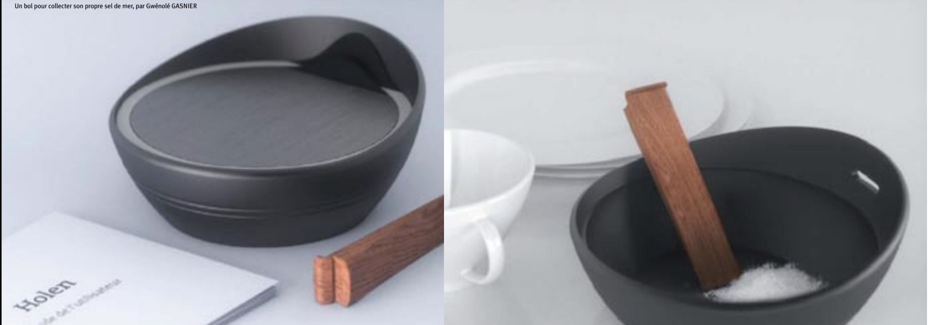
Un bol pour collecter son propre sel de mer, par Gwénoél GASNIER

N° 22 - Avril 2010. Ce bulletin d'information trimestriel présente l'actualité des travaux réalisés par les étudiants de la section BTS Design de Produits du lycée Vauban, à Brest. Il est diffusé auprès des représentants des collectivités locales, des responsables des entreprises et agences de design, et des établissements d'enseignement des arts appliqués. Pour nous écrire : bts.design.brest@free.fr , ou par courrier : BTS Design de Produits, lycée Vauban, rue de Kérichen, BP 62506, 29225 Brest cedex 02 - Tél 02 98 80 88 00. Plus d'informations sur www.designdeproduits.fr