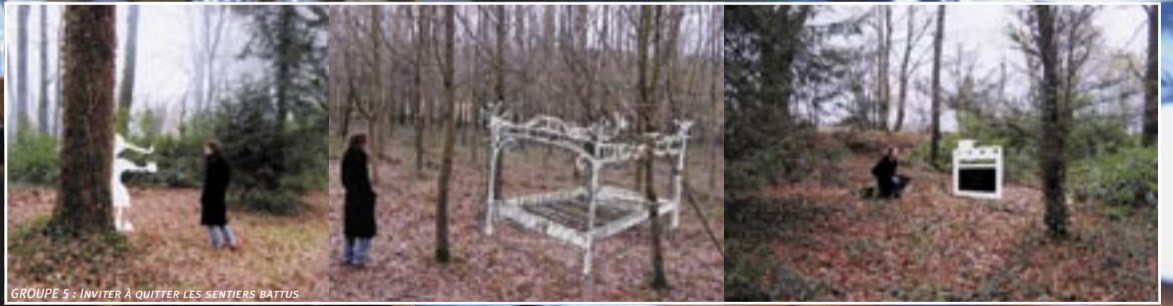
GROUPE 5 : INVITER À QUITTER LES SENTIERS BATTUS