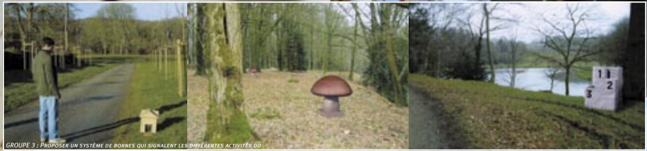
GROUPE 3 : PROPOSER UN SYSTÈME DE BORNES QUI SIGNALENT LES DIFFÉRENTES ACTIVITÉS DU