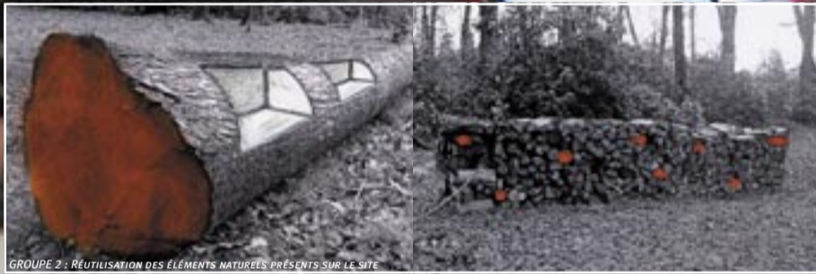
GROUPE 2 : RÉUTILISATION DES ÉLÉMENTS NATURELS PRÉSENTS SUR LE SITE