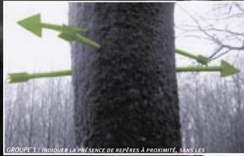
GROUPE 1 : INDICER LA PRÉSENCE DE REPÈRES À PROXIMITÉ, SANS LES

Parc de sculpture, centre d'art contemporain, et centre culturel de rencontres, le Domaine de Kerguéhenec (dans le Morbihan) a accueilli nos étudiants de 1 ère et 2 e année pour un workshop d'une semaine, animé par le designer Nicolas Prioux. Le projet consistait à repenser la signalétique et le mobilier de ce parc de 175 ha, en accordant une place de choix à ses usages parallèles : pique-nique, promenade, pêche, parcours sportif... Les étudiants ont formé cinq groupes et présenté cinq propositions, mises en volume directement sur site.