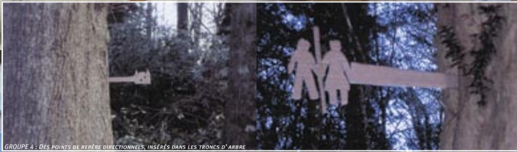
GROUPE 4 : DES POINTS DE REPÈRE DIRECTIONNELS, INSÉRÉS DANS LES TRONCS D'ARBRE