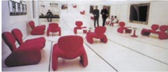
Olivier MOURGUE : sièges Djinn dans le film de Stanley Kubrick « 2001 : A Space Odyssey », 1968

Rétrospective au musée des Beaux Arts de Brest. Visite guidée, rencontre et discussion avec le maître.